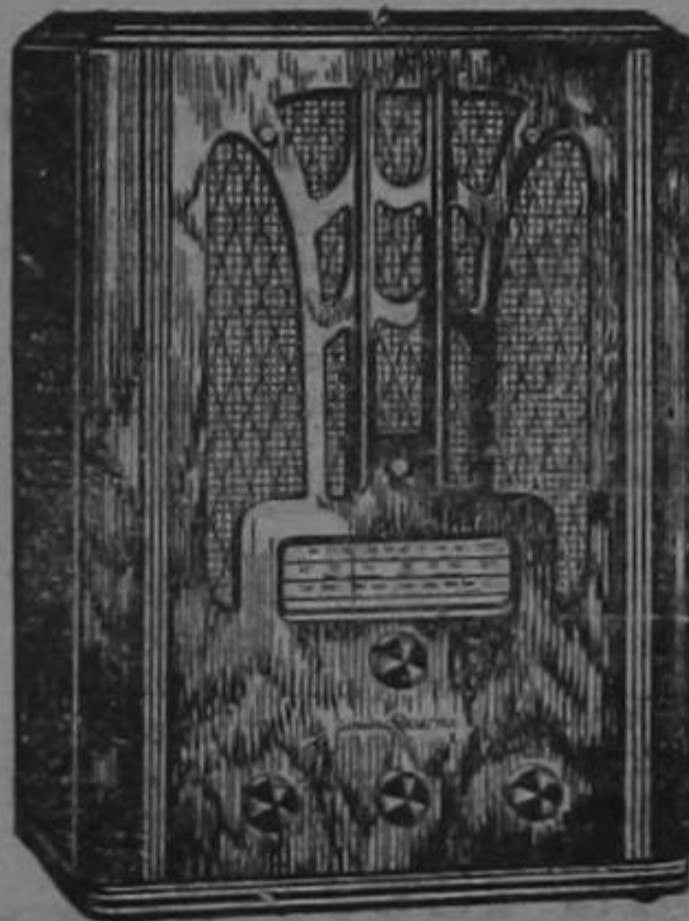
RADIO G. E. MODELO E-81

La rara belleza de sus muebles constituye la nota característica de la serie 1936-1937 de radios General Electric, debida al genio creador del propio estilista de la G.E., uno de los dibujantes industriales de más renombre en los Estados Unidos.